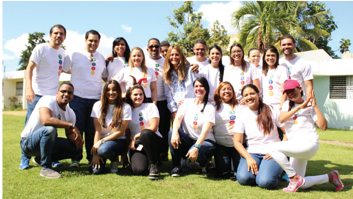
Colaboradores miembros del voluntariado Banesco, en actividad con Aldeas Infantiles.

mecanismos de suministro por reposición no amenacen la calidad y el sentido de oportunidad de los procedimientos clínicos a los que son sometidos los pacientes de cáncer.