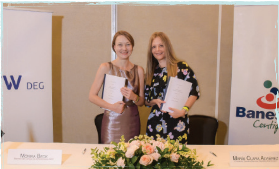
Firma convenio Banesco - DEG.