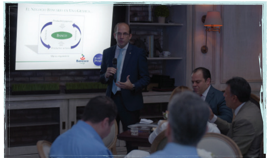
Lanzamiento Plan Pyme.